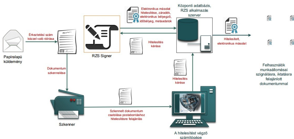
1. ábra: Papíralapú iratról hiteles elektronikus másolat készítésének rendszerszintű feldolgozási folyamata