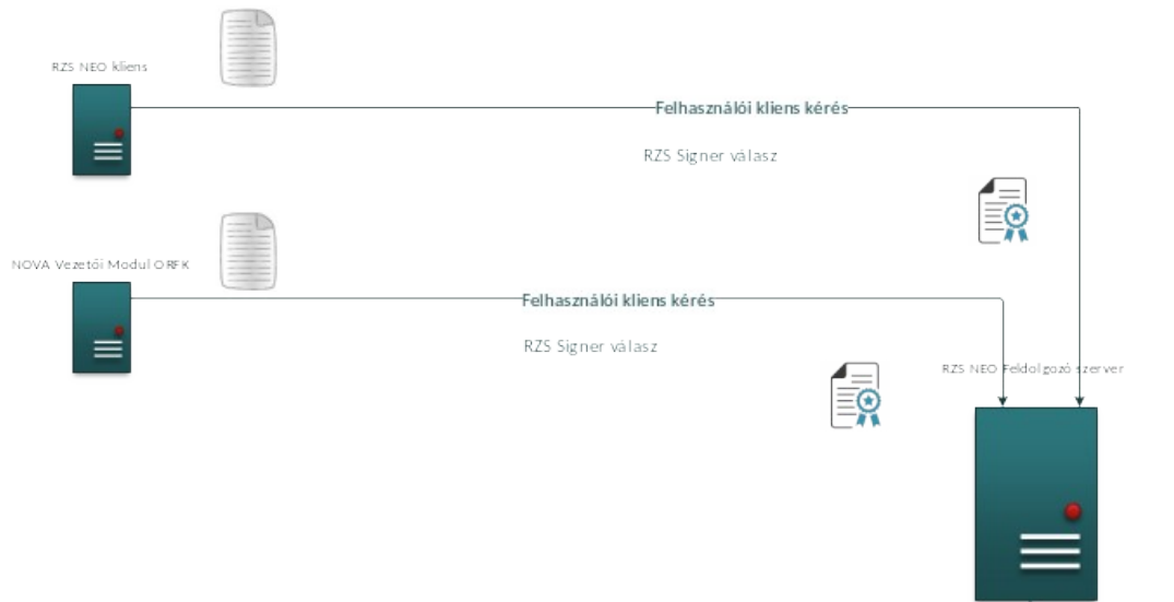
2. ábra RZS Signer hitelesítés funkció rendszerszintű működése

Az időbélyeg azt igazolja, hogy az adott dokumentum egy adott időpillanatban már létezett. Az időbélyeget a NISZ Nemzeti Infokommunikációs Szolgáltató Zrt. időbélyegzés szolgáltató állítja ki. Az időbélyeg egy olyan adat, amely tartalmazza az időbélyegzett dokumentum lenyomatát és az időbélyegzés időpontját. Az időbélyeget egy időbélyegzés szolgáltató hitelesíti saját aláírásával.