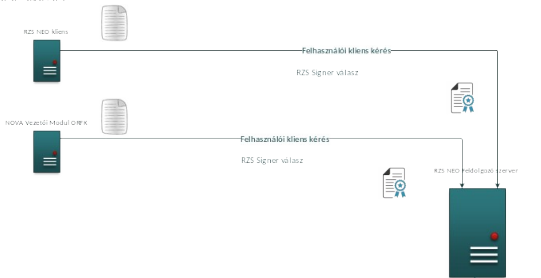
2. ábra RZS Signer hitelesítés funkció rendszerszintű működése

Az időbélyeg azt igazolja, hogy az adott dokumentum egy adott időpillanatban már létezett. Az időbélyeget a NISZ Nemzeti Infokommunikációs Szolgáltató Zrt. időbélyegzés szolgáltató állítja ki. Az időbélyeg egy olyan adat, amely tartalmazza az időbélyegzett dokumentum lenyomatát és az időbélyegzés időpontját. Az időbélyeget egy időbélyegzés szolgáltató hitelesíti saját aláírásával.