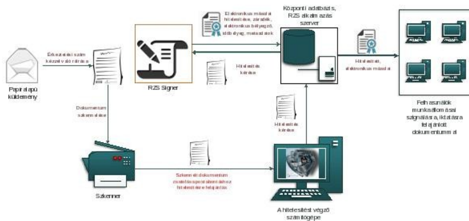
1. ábra: Papíralapú iratról hiteles elektronikus másolat készítésének rendszerszintű feldolgozási folyamata

Az elektronikus aláírás, a metaadatrendszer elektronikus példányra történő bekerülésének biztonságát a szerver oldali feldolgozás biztosítja.