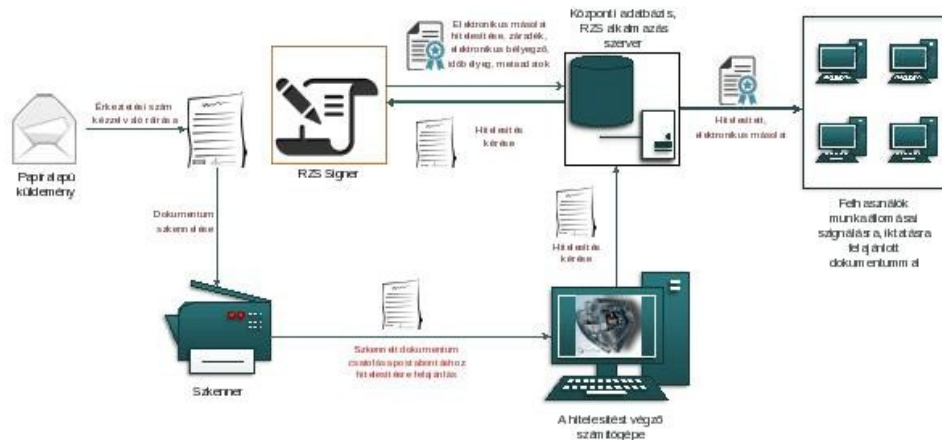
1. ábra: Papíralapú iratról hiteles elektronikus másolat készítésének rendszerszintű feldolgozási folyamata

Az elektronikus aláírás, a metaadatrendszer elektronikus példányra történő bekerülésének biztonságát a szerver oldali feldolgozás biztosítja.