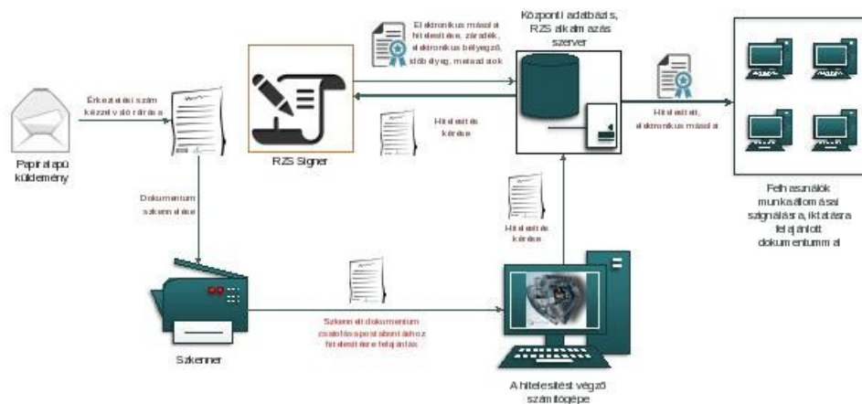
1. ábra: Papíralapú iratról hiteles elektronikus másolat készítésének rendszerszintű feldolgozási folyamata

Az elektronikus aláírás, a metaadatrendszer elektronikus példányra történő bekerülésének biztonságát a szerver oldali feldolgozás biztosítja.