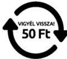
Egyszer használatos, egyutas palack jelölése

Az átvétel során – a jogszabályi környezetnek megfelelően – csak az Eljárásrendben is meghatározott deformitás mentes, sértetlen, kupakkal ellátott betétdíjas PET palack kritériumainak megfelelő, a visszaváltáshoz szükséges felirattal és kóddal megjelölt betétdíjas termékek kerülnek visszavételre.