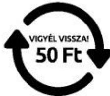
Egyszer használatos, egyutas palack jelölése

Az átvétel során – a jogszabályi környezetnek megfelelően – csak az Eljárásrendben is meghatározott deformitás mentes, sértetlen, kupakkal ellátott betétdíjas PET palack kritériumainak megfelelő, a visszaváltáshoz szükséges felirattal és kóddal megjelölt betétdíjas termékek kerülnek visszavételre.